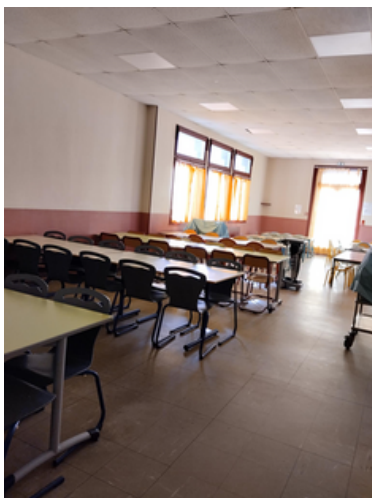
Réfectoire pour tous les enfants