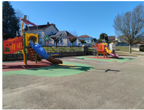
Espace de jeux extérieur pour les enfants -6ans