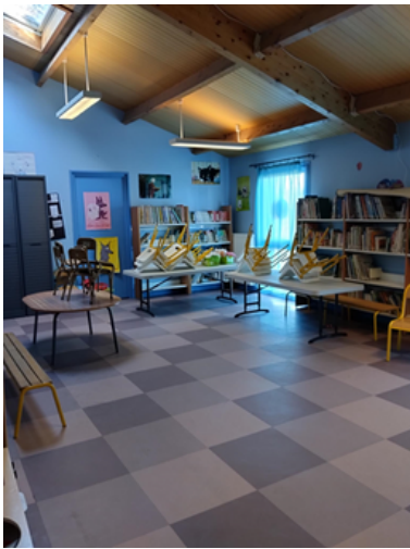
Salle d'activité pour le groupe de - 6ans qui sert aussi à la semaine de BCD