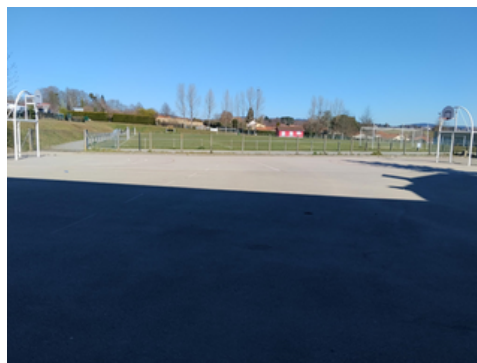
Cours de l'accueil de l'ALSH