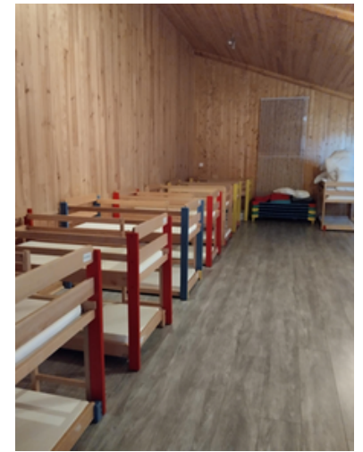
Dortoir pour les - 6ans, nous utilisons les lits proches du sol ainsi que des lits amovibles.